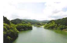
富士しゃくなげ湖(嘉瀬川ダム)