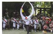
市川の天衝舞浮立