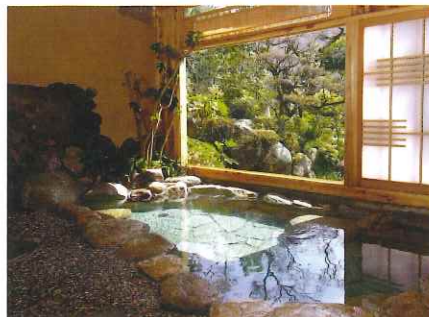
古湯・熊の川温泉